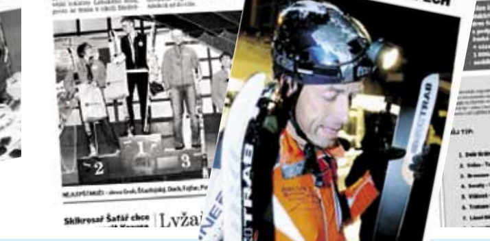
ŠKILPESČ ŠAŤAŘ CHCE LVŽA.

Na třetí k medaili v závěrečném běhu na 10 kilometrů se utkalo 100 závodníků z 45 zemí. Vítězství získal norský závodník Bjørn Dæhlie, který získal zlatou medaili. Stříbrnou medaili získal švédský závodník Marcus Sandberg a bronzovou medaili získal norský závodník Petter Tjøm.